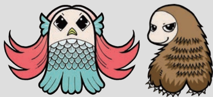
防疫妖怪「阿瑪比埃」