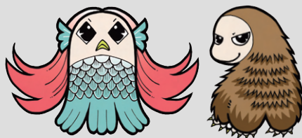
防疫妖怪「阿瑪比埃」