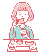
交流时用手帕等挡住嘴