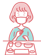
就餐时如需交流， 请佩戴好口罩