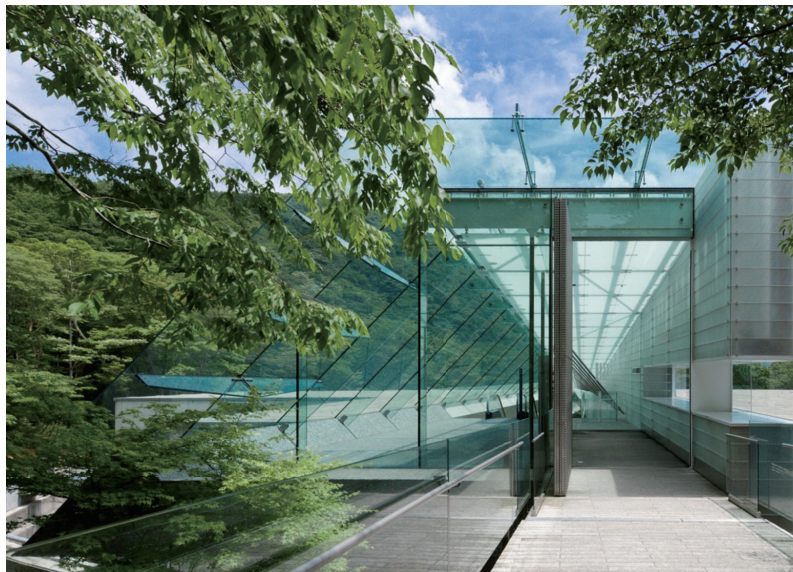
モネやルノワール等の印象派の絵画を中心に、日本画やガラス工芸などをコレクションする森の中の美術館です。