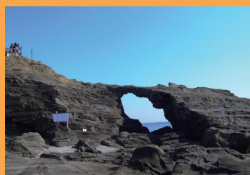
写真は「馬の背洞門」

ミシュラン・グリーンガイド・ジャポン改定第3版に二つ星として掲載。西部からは相模湾越しの富士山を、南部のハイキングコースからは、雄大な太平洋と奇岩「馬の背洞門」が望めます。