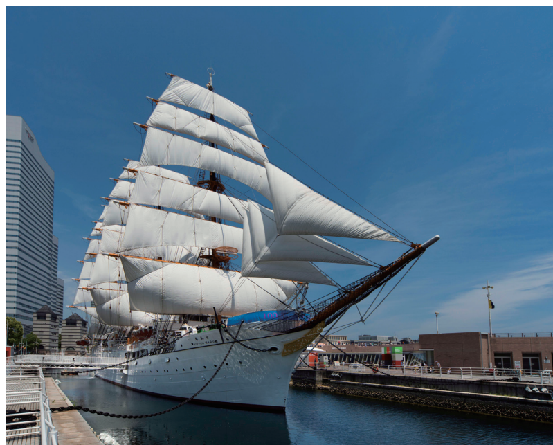
年間約12回すべての帆を広げる総帆展帆