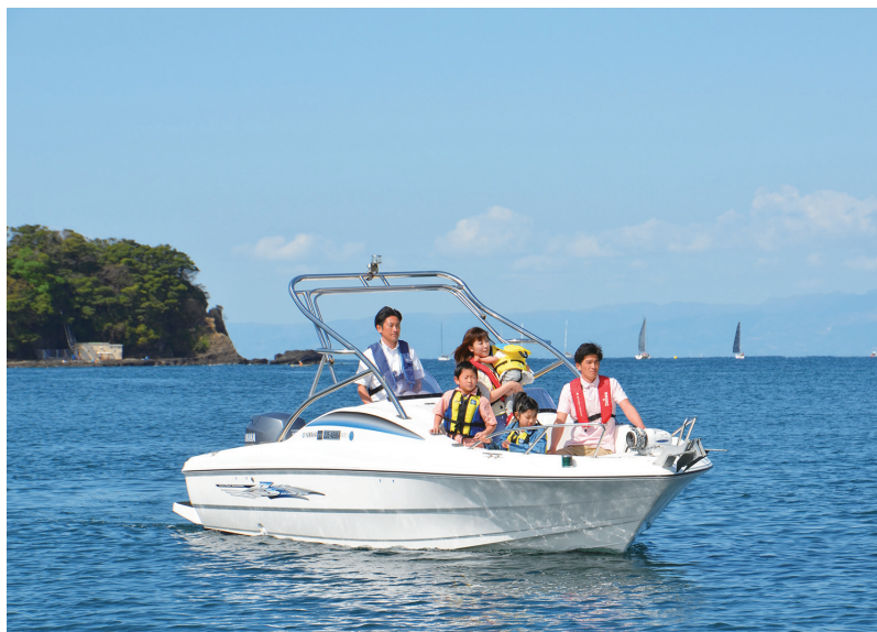
リビエラリゾートでは、リビエラ逗子マリーナ、シーボニアマリーナにそれぞれレストランがあり船での移動もアレンジ可能。