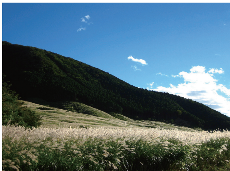
9月下旬から11月初旬の頃にかけてススキの穂が黄金色に染まり、山肌一面に広がる美しい景観は、仙石原の秋の風物詩。