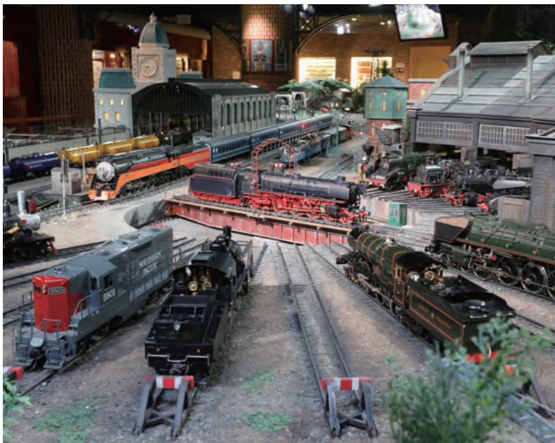
世界一ともいわれる多様な鉄道模型や鉄道コレクションを展示しています。